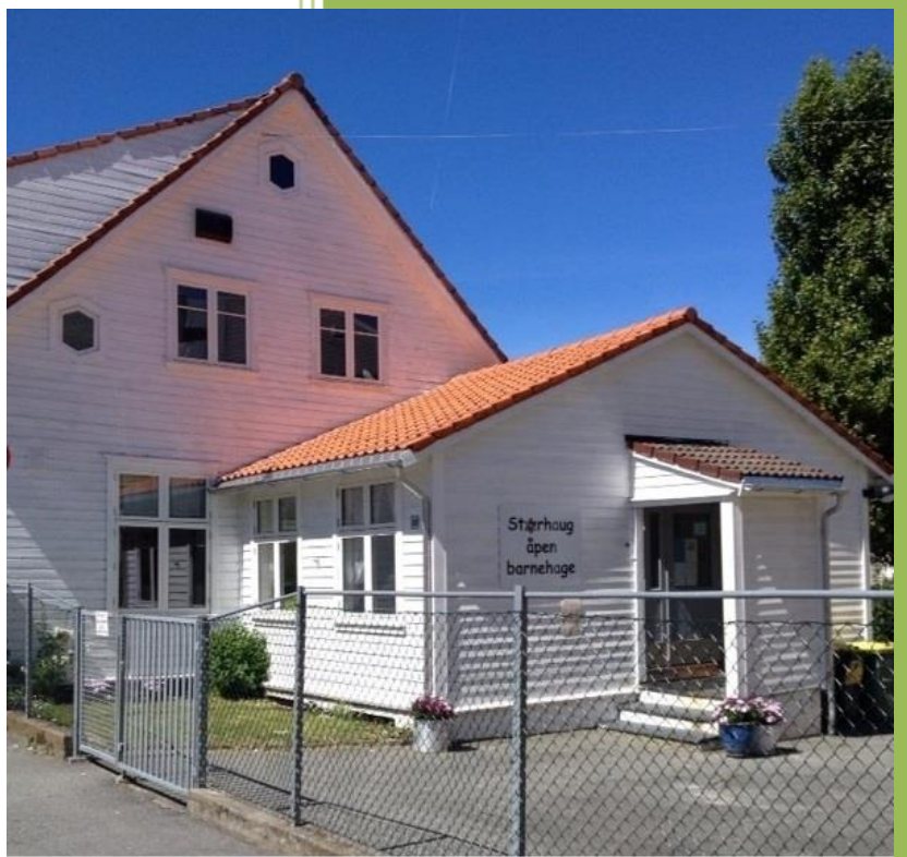
Storhaug åpen barnehage